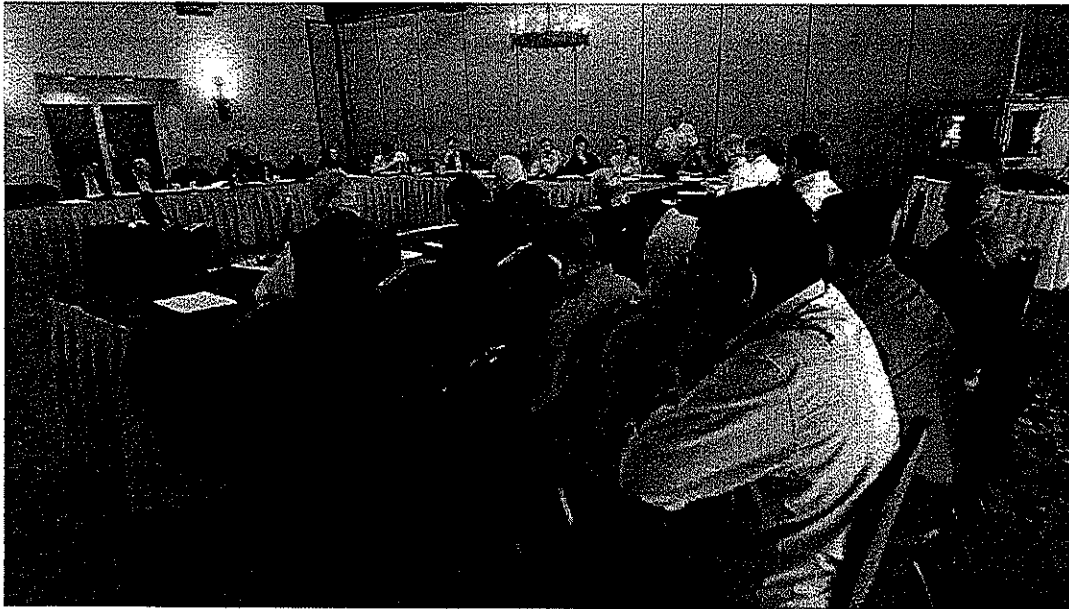
Figura 1.- Mesa de discusión de la Reunión.

Finalmente se da un resumen general de la sesión y se da por terminada la reunión.